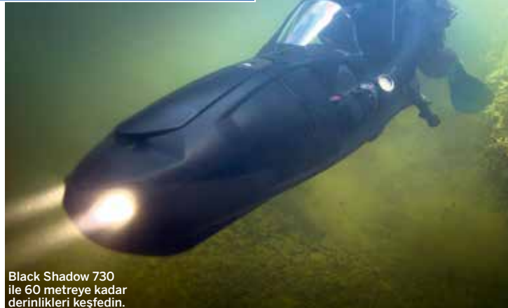
Black Shadow 730 ile 60 metreye kadar derinlikleri keşfedin.

daha amansız bir yapıda ve 8hp ve 75kg itme gücüyle sualtında gezinmek için müthiş bir sürat olan 8mph'ye kadar çıkabiliyor.