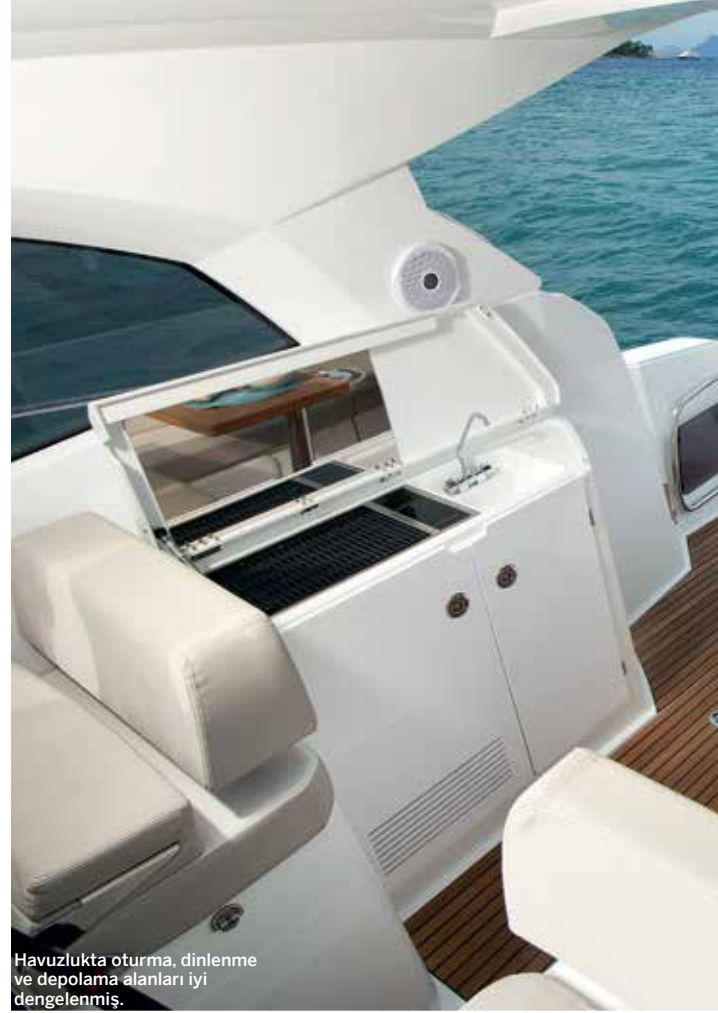
Havuzlukta oturma, dinlenme ve depolama alanları iyi dengelenmiş.

Belki de Jeanneau'nun yelkenli yatlarından esinlenilerek düşünülmüş, salon kanepesinin uç kısmındaki ufak bölüm çocuk yatağı olarak kullanılabilir; Leader 36 kesinlikle çok kullanışlı bir tekne. >>>