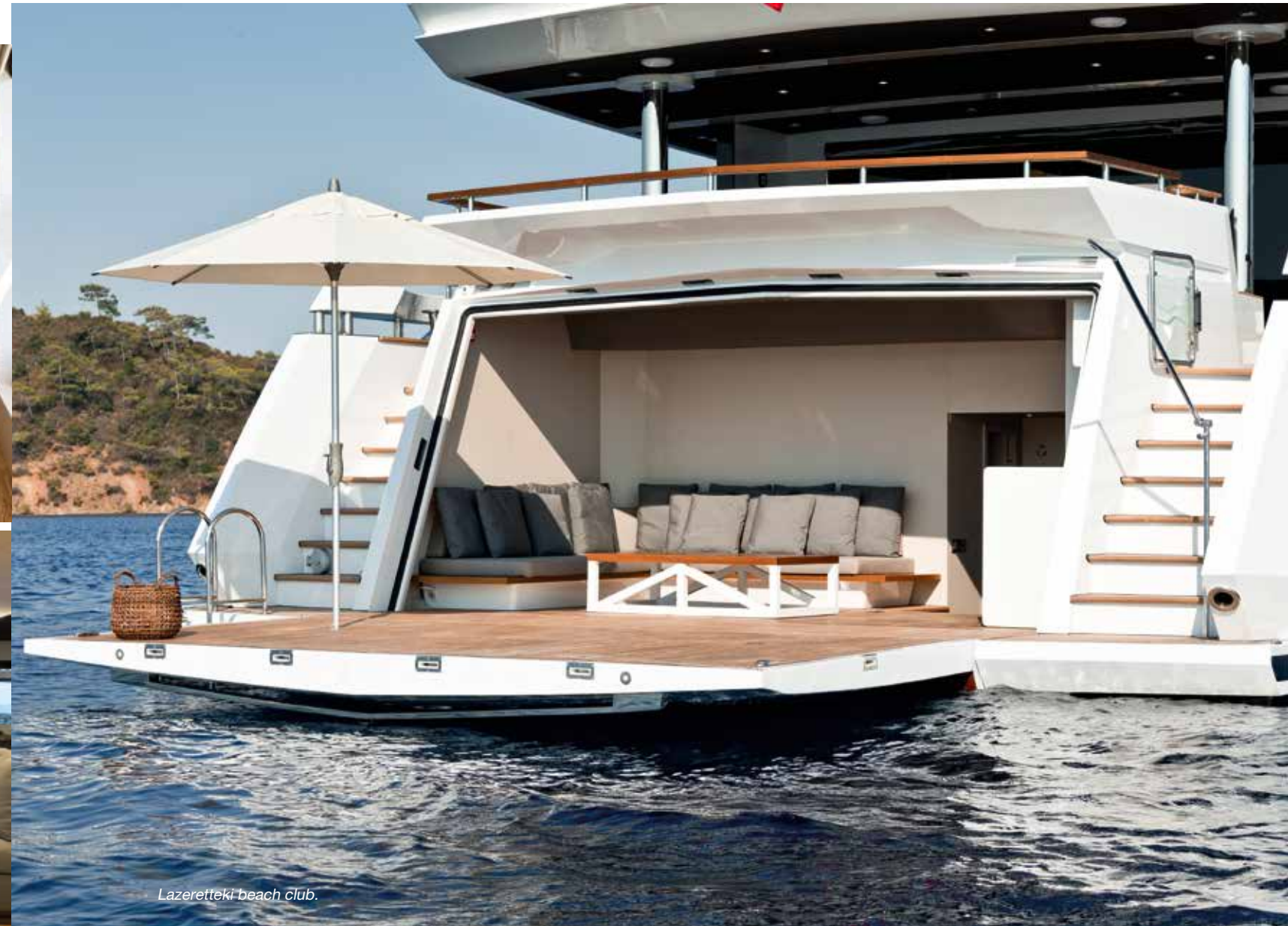
Lazeretteki beach club.