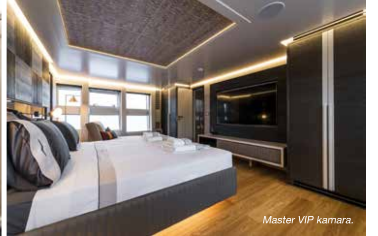
Master VIP kamara.

Sancaktaki kapıdan girdiğimiz holde spor salonu, günlük tuvalet, alt güverte ve üst güverteye erişimi sağlayan merdivenler ile baş taraftaki master VIP kamaraya açılan kapı ile karşılaşıyoruz. Holün sancak yanını tamamen kaplayan spor salonuna hem yan güverteden hem de holden girilebildiğini de belirtelim.