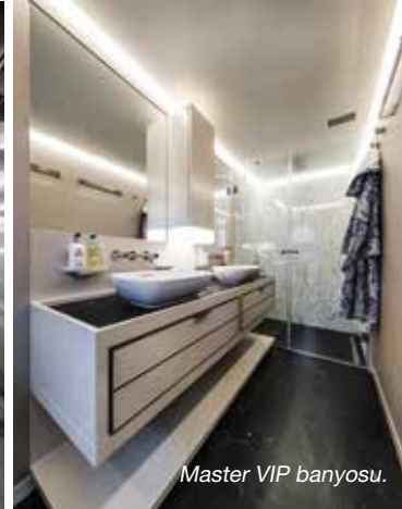
Master VIP banyosu.