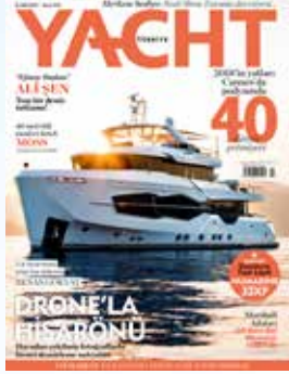
Yazı EYÜP ÖZEL