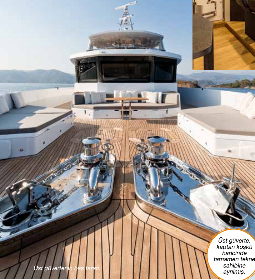
Üst güvertenin baş tarafı.