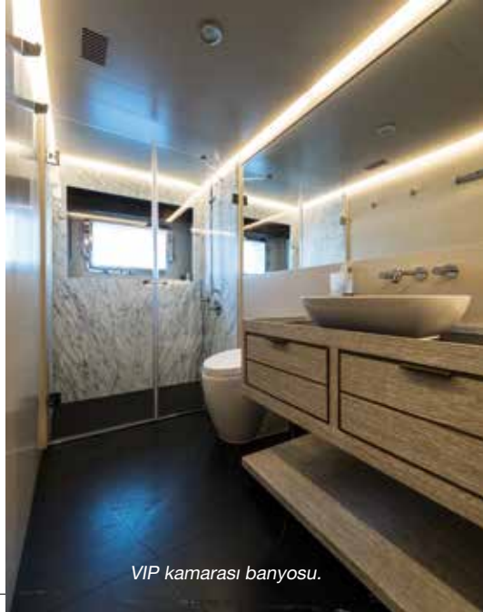
VIP kamarası banyosu.

32 metrelik tekneye kaptanla birlikte toplam beş mürettebat hizmet veriyor. Mürettebat için alt güvertenin baş tarafı ayrılmış. Buraya erişim de teknenin iskele tarafından yapılmış. Ana güvertede, salondaki iskele kapıdan girdiğimiz mutfak Öztiryakiler marka endüstriyel mutfak gereçleri ile donatılmış. Flybrdige için mutfakta yemek asansörü de var. Mutfağın iskele tarafındaki merdivenden başaltına iniliyor. Burada ilk olarak çamaşırhane karşılıyor. Onun yanında yine endüstriyel tip derin dondurucular var. Sonra sancak yanda kendi banyosu olan büyük kaptan kamarası ile devam ediyor. İskele tarafta mürettebatın mutfağı ve dinlenme alanı var. Başta ise iki ayrı yataklı, iki ayrı banyolu, iki mürettebat kamarası... ▶