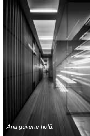
Ana güverte holü.

Ana güvertede salondan sonra iki kapı ile baş tarafa geçiliyor. İskeledeki kapı mutfığa ve oradan da başaltındaki mürettebat alanına ulaştırıyor. Sancaktaki kapı ise bir hole açılıyor ve buradan spor salonuna, ana güvertedeki master VIP kamaraya ve alt ile üst güvertelere geçiş var. Böylece mürettebat ile konukların yaşam alanları ayrılmış ve mürettebat çalışırken hiçbir şekilde konukların alanından geçmiyor.