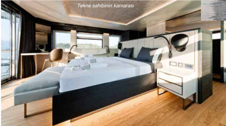
Tekne sahibinin kamarası

Ana güverte sancak holündeki merdivenden aşağıya, alt güverteye inmiştik. Alt güverteye inen merdivenin basamakları ahşap; aynı yerden üst güverteye çıkan basamaklar ise cam. Buradan çıkınca yukarıda küçük bir hole ulaşıyor. Baş taraftaki kapı kaptan köşküne, iskeledeki kapı da owner süite açılıyor. Üst güverte kaptan köşkü haricinde tamamen tekne sahibine ayrılmış. 40 metrekairelik bir alan sunan büyük bir kamara ve 129 metrekairelik açık alandan oluşuyor.