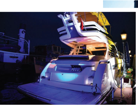
Fairline Squadron 53, düzenlenen gecede ziyaretçilerden tam not aldı.